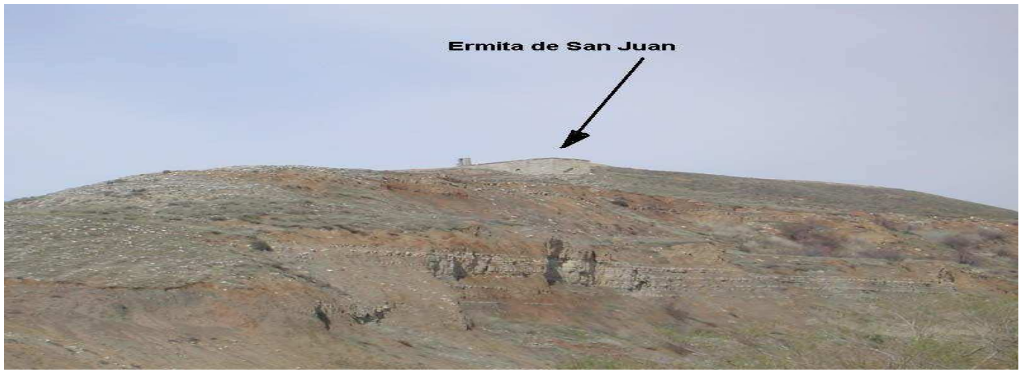
ERMITA DE SAN JUAN