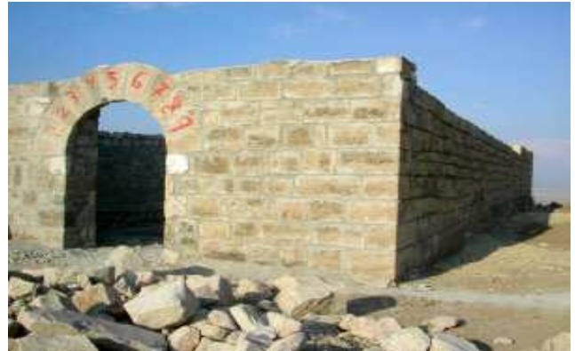
ERMITA DE NUESTRA SEÑORA DEL CASTILLO, IMAGEN Y TORREON