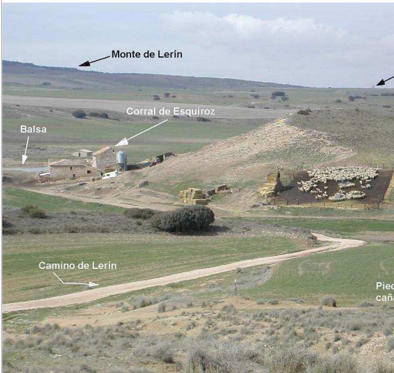
Vista general cuando vamos hacia Lerín (Foto tomada después de las viñas del Señoría de Sarría)

Observaciones: Hasta llegar al kilómetro 6,5 el terreno pica ligeramente hacia arriba. A partir de este kilómetro hay varios repechos y, a continuación, tramo recto y plano hasta Lerín. Comenzamos la subida al monte de Lerín y continuamos por la cresta disfrutando del trazado y del paisaje. Al final del monte se corta la senda y tenemos que bajar de la bicicleta para bajar un terraplen y salir a pista principal. Bajamos hasta el Corral de la Sarda y luego ascendemos con fuerte pendiente (desnivel medio del 10%) hasta la falda del Monte Jenariz (554 metros) para continuar con un impresionante descenso hasta Miranda de Arga.