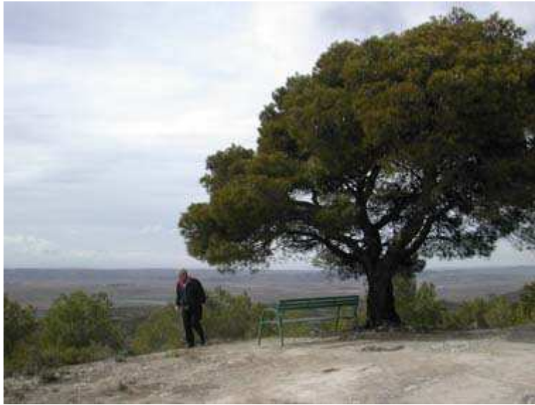
Vista durante la subida al monte.