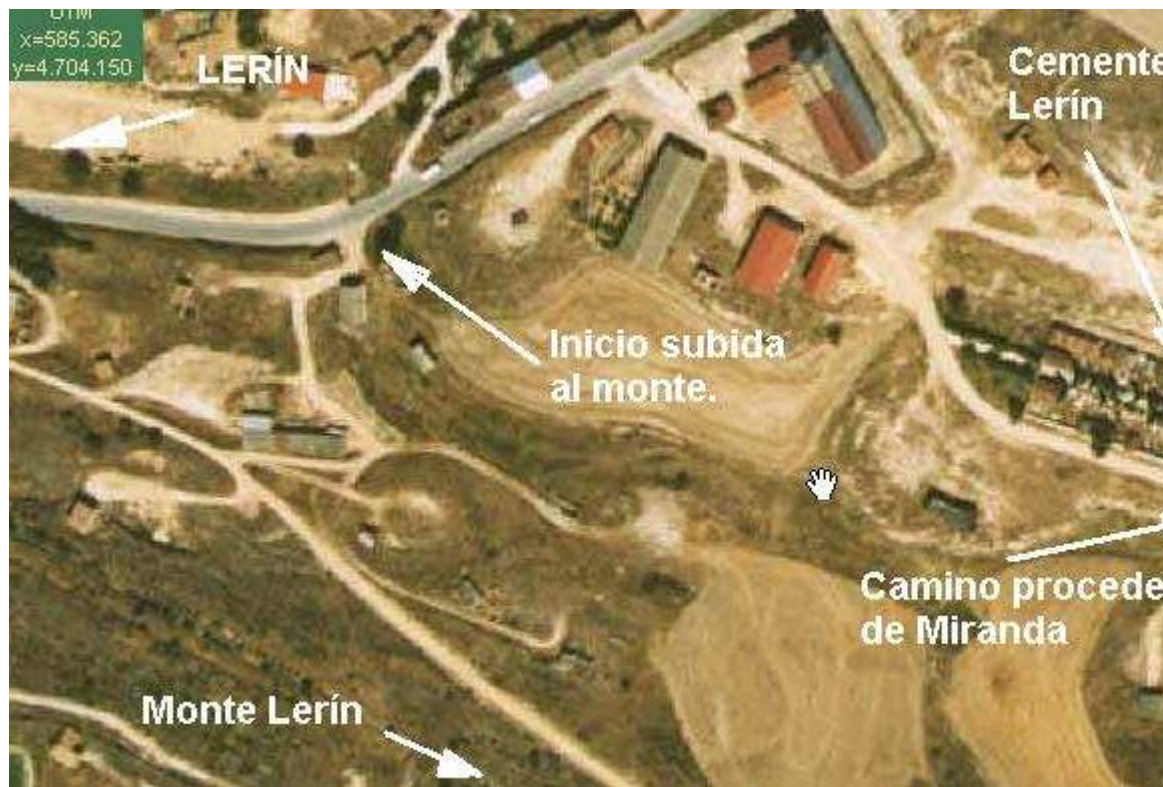
KM 13,7 - Salimos de la carretera y tomamos camino a la izquierda para subir al monte de Lerín