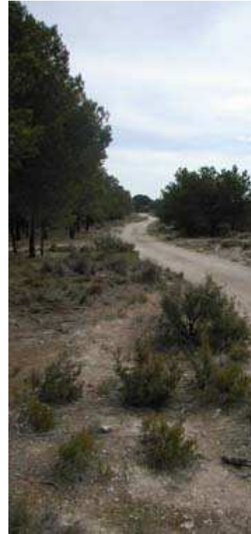
KM 21,9 - Salimos a pista por el repecho y luego tomamos camino en dirección al Caserío de la Sarriena