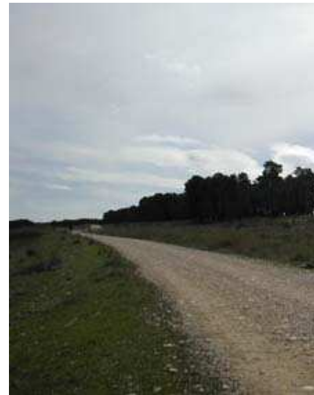
KM 17,7 Mirador con árbol y banco en el monte de Lerín. Lugar para un descanso y disfrutar de las vistas.