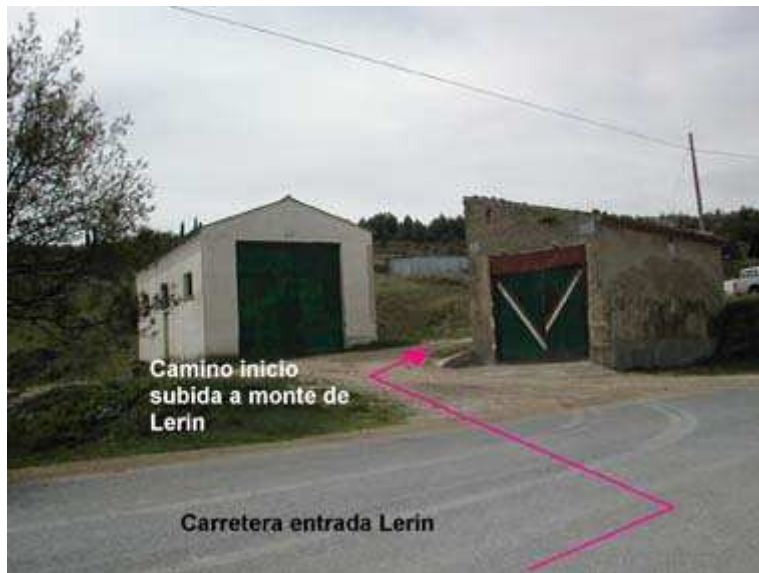
KM 14,6 - Tomamos ramal de