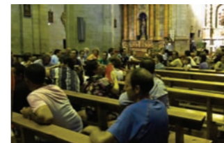
Visita guiada a la iglesia de San Miguel Arcángel de Larraga

A mediados de septiembre se organizarán dos visitas guiadas a todos los monumentos que integran la ruta. Estarán dirigidas a los colectivos locales (asociaciones de mujeres, jubilados, etc.) y previamente se informará sobre ello.