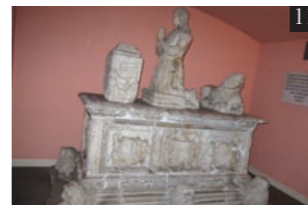
Sepulcro de los condes de Lerín. Palacio de Lina, Madrid (F. J. Virto)